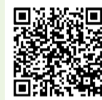
SPOFIT 江南スポーツクラブ

詳しくは同館で配布するパンフレットや「SPOFIT 新潟江南スポーツクラブ」のホームページに掲載 問同館へ電話(☎025-385-4477)で仮予約後、来館にて申込