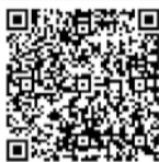
シルバーチケット