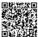
にいがたバス乗換案内サイト

また、スマートフォンなどで時刻や経路などを確認できる「にいがたバス乗換案内サイト」も併せてご活用ください。