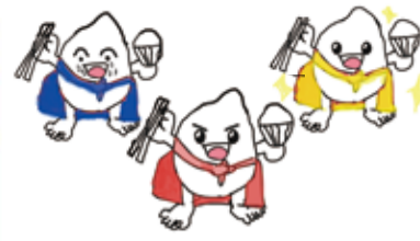
キャラクター(コメレンジャー)