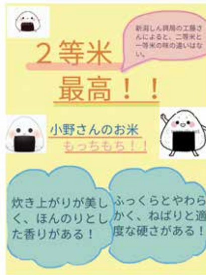
二等米の魅力伝えるポスター

他のグループは、二等米の魅力発信やお米に対する興味に繋がるクイズやキャラクター、動画、ポスターなどをそれぞれ作成しました。1年間の学習を通じて、児童は自分たちなりに調べてまとめ、発信する力をつけたほか、お米への愛着を深められたことが伺えました。