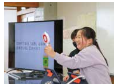
お米に親しみを持てるクイズ