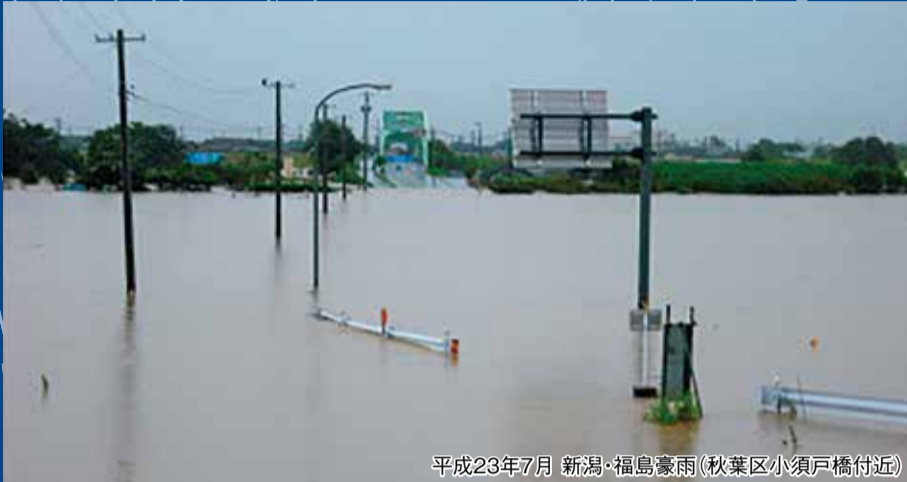
平成23年7月 新潟・福島豪雨(秋葉区小須戸橋付近)

江南区 人口：67,527人(+9) 男：32,885人(-1) 女：34,642人(+10) 世帯数：28,506世帯(+16) 面積：75.42km 2 令和6年5月末現在(カッコ内は前月比 住民基本台帳による)