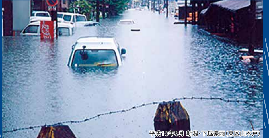
平成10年8月 新潟・下越豪雨(東区山木戸)