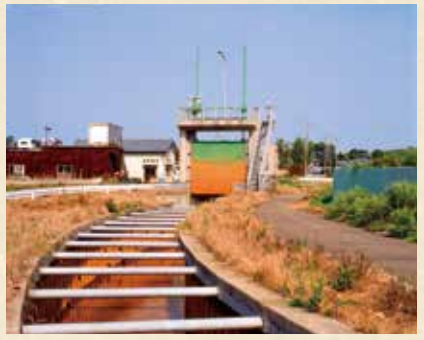
横越排水路上流調整ゲート