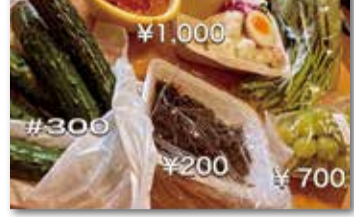
SNSには、野菜の安さに驚いた方からの投稿も

私が祖父母から酒屋を継ぎ、仕事をする中で、人と人の繋がりを感じたり、地域のあたたかさを感じる機会が多くありました。個人商店の閉店が続くなかで、朝市はこのような販売者と購入者のコミュニケーションを楽しめ、人のあたたかさを感じられる貴重な場だと感じます。