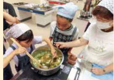
味噌汁を作る様子