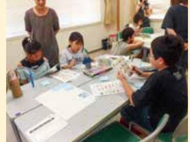
具材を検討する様子