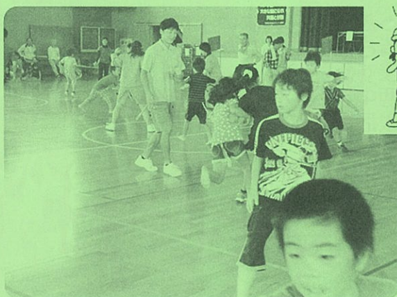
▲この競技は「しっぽとりゲーム」と言って、しっぽをスポン等の後ろにはさんで相手から取られないように、ひたすら逃げる。取られたら負けだ！