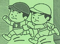
▲かごからボールを落とさずに、ゆっくり ゆっくり運ぶ「ボール運びレース」