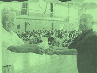
【赤組】準優勝賞品授与