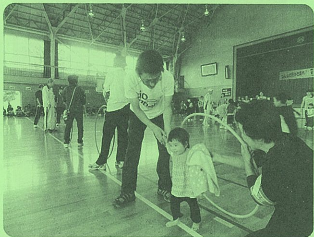
▲幼児レースは、フラフーフをくぐって、