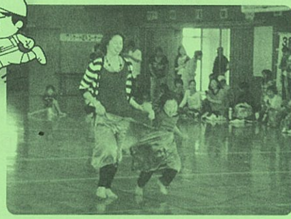
▲親子で“テカパンツ” 微笑ましい光景です。