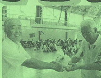
【黄組】第3位賞品授与