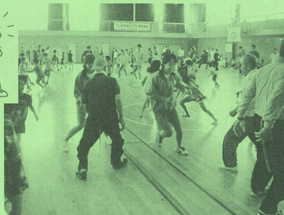
▲「しっぽ」を取られまいと必死に逃げ回っているが・・・！ 結果はどうだったのでしょうか？