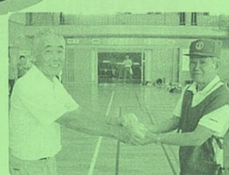
【緑組】第4位賞品授与