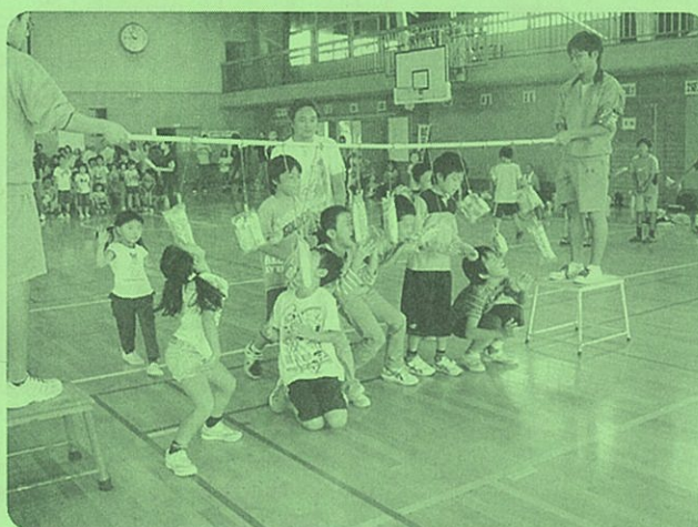
▲パンのためなら!! ほかも!わたしも!