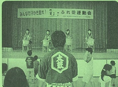
▲中島の有志による「樽ッ子クラブ」実演