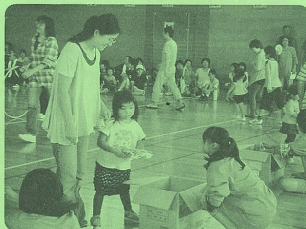
ごほうびのお菓子をもらってゴールイン!