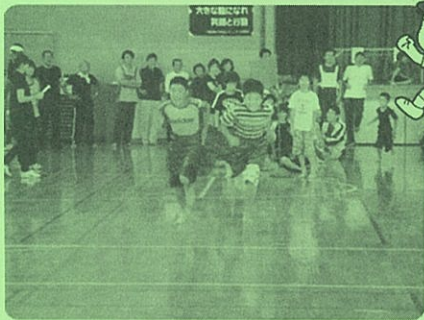
▲人気競技！テカパンツ レース！