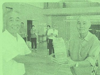
【青組】優勝賞品授与