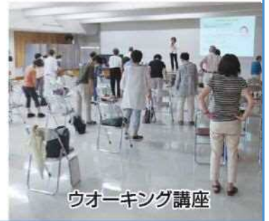
ウォーキング講座