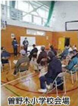
曾野木小学校会場

【全体説明会】 テーマ：避難所による感染症対策 9月30日（水） 江南区文化会館