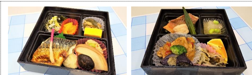
夕食けんぴ膳DX (お弁当タイプ、おかずのみ 540円)