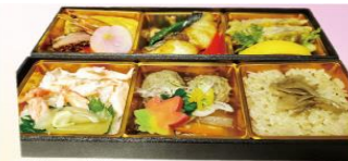
菜の花 二段弁当(梅) 1,500円(税別)

八寸、焼物、煮物、 季節のご飯などを リーズナブルに 召し上がれる お弁当です。