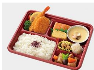
弁当 1千円 (1,080円)