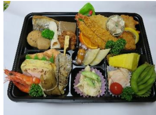
夕食折詰 (いなり寿司入り 2,160円)