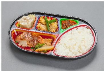
まごころ弁当 (ごはん 170g 付 562円)