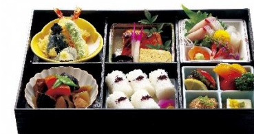
弁当 3千円 (3,240円)