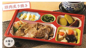
健康ボリューム食 (おかずのみ 606円)