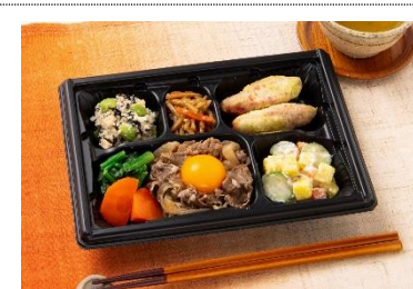
まごころおかず (3,080円)