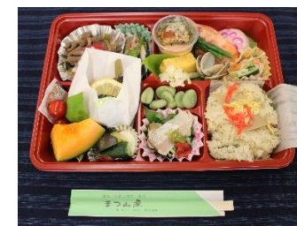
弁当 (夜 700円)