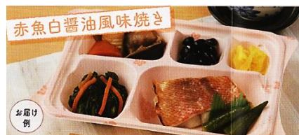
普通食 (おかずのみ 540円)