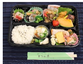
弁当 (昼 700円)