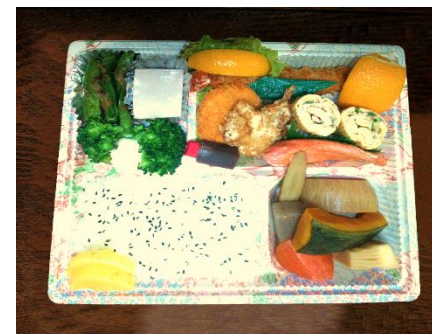
おまかせお弁当 (1,080円)