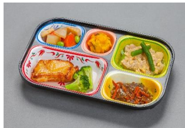
まごころ弁当 (おかずのみ 497円)