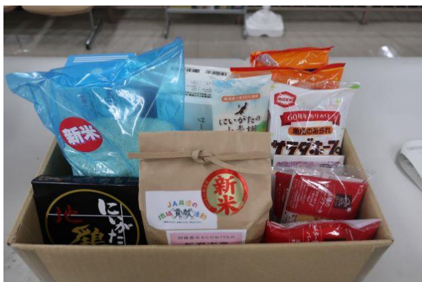
寄贈いただいた物資

○10月27日（水）に「ふるさと江南区宅配便 物資等の贈呈式」を開催し、協賛企業へ、感謝状を進呈した。