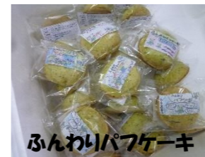
ふんわりパフケーキ