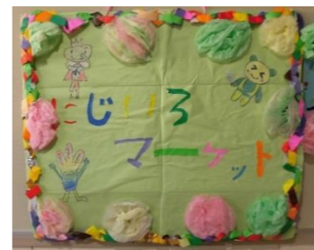
にじいろマーケットの手作り看板