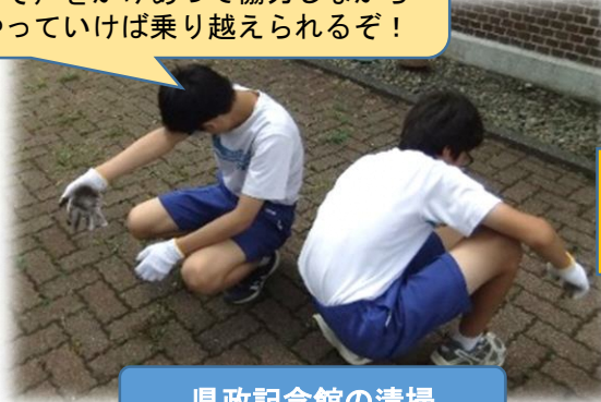
県政記念館の清掃