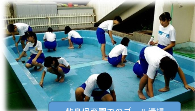
敷島保育園でのプール清掃