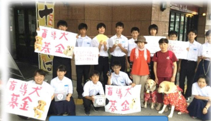
古町で盲導犬募金