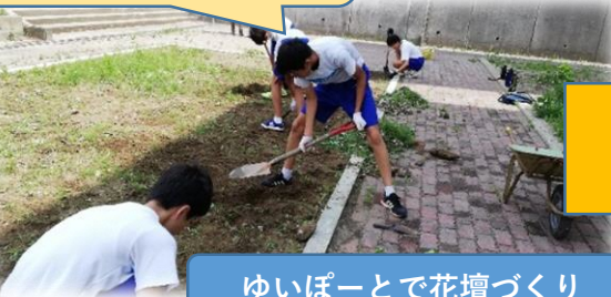
ゆいぽーとで花壇づくり