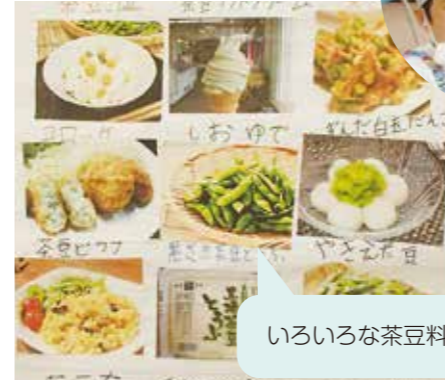
7月20日 すんだ白玉作り