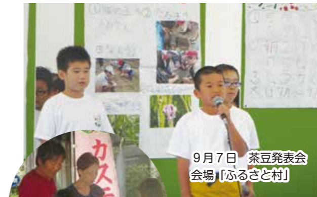
9月7日 茶豆発表会 会場「ふるさと村」