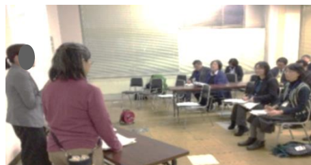
令和元年度実践報告会

令和元年度学校図書館活用推進校の実践報告会が2月に行われました。今年度の実践報告会は、学習センター、情報センターの機能を高める取組が多く取り上げられていました。子どもに情報活用能力、思考力を育むのだという熱い思いが伝わる報告でした。また、読書センターの機能を高める取組では、子どもが主体となって読書活動を推進する姿、子どもが本の世界に没入する姿が十分に伝わる報告もありました。報告後は、「小学校では、情報活用能力をどこまで育成しているのか（中学校との系統性を確認するために質問した）」など、日頃の疑問や悩み、各校の実践のコツなどについて語り合いました。大変和やかに温かい交流ができ、学びの多い報告会となりました。