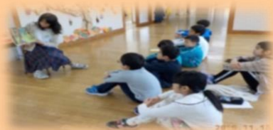
万代 長嶺 小学校