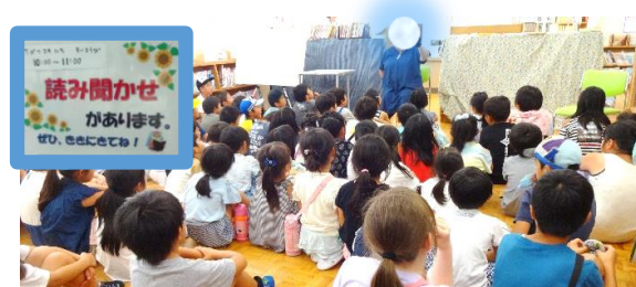
「おはなしどんどろ」のみなさんによる、「夏休み 読み聞かせスペシャル」