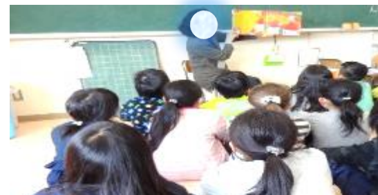
毎週金曜日 「朝読書」