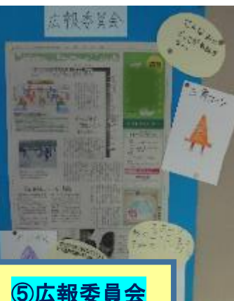
⑤広報委員会による新聞活用

○図書館へ積極的に行くようになった ○語彙が増えた ○集中力がついた ○すき間読書をする子が増えた ○司書が本を紹介することで、ジャンルの幅が広がった