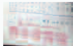
スタンプと言葉によるメッセージでの評価例

内容によって軽重をつけ、スタンプやシールなども活用しながら、温かい励ましやアドバイスを伝える方法もあります。