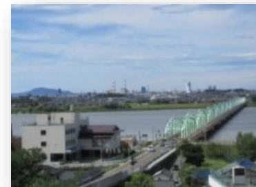
あかしあ公園から松浜橋と角田山を望む