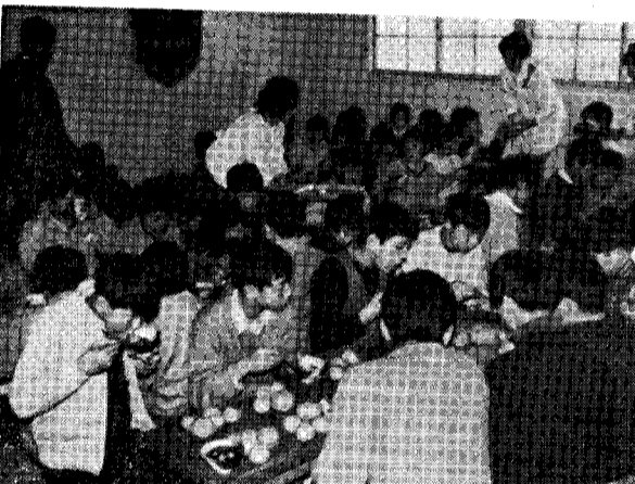
おしるこにしたつみ