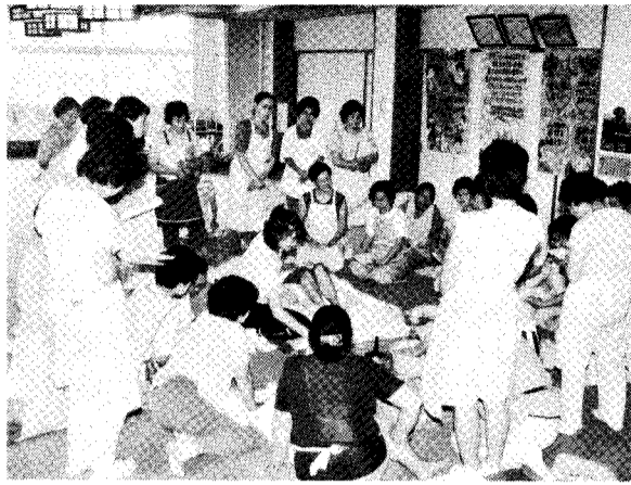
家庭看護教室 ～役場町民生活課～

日本は、かつてない高齢化社会にまた一歩近づきました。当町でも、六十五才以上の人口の占める割合(高齢人口)は、六十三年四月現在で十四・九%と県平均の十四%をかなり上回っています。