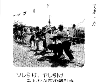
ソレ引け、やし引け みんな必死の綱引き

【矢代田分館】 山の手運動会 期日 九月二十七日(日) 午前八時三十分開会 会場 矢代田小グラウンド 雨天の場合十月四日