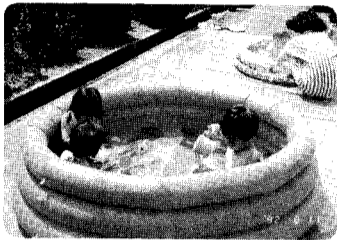
8月11日つくしんぼ 8月19日あすなろつ子広場 夏はやっぱり水浴びが楽しい!