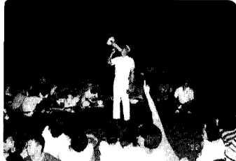
8月29日ナイトウォーク「あれが白鳥座だから、あれかな?」(参加者の声)