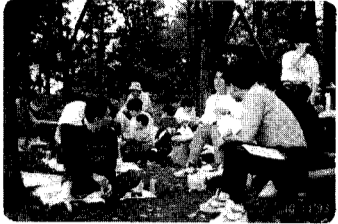
17日 新保分館菩提寺山ハイキングイヤーはじめて来たけどいい所だねつが。また、みんなしてこれ。