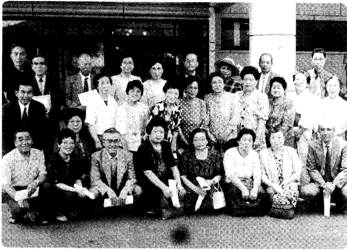
リーダー交流会、今年は村松町のさくらんどう会館を視察し、村松町文化協会との文流を行ってきた。結成5年を迎えた文化協会、今後の一層の活躍を期待したい。

昭和六十三年九月、小須戸町の文化活動の一層の充実と、各種文化団体の連携を目指し、「小須戸町文化協会」が発足しました。あれから五年、小須戸町文化協会はどのような役割を担い、そしてどのような活動を行ってきたのでしょうか。ここで、更なる発展の為の課題を考えてみましょう。