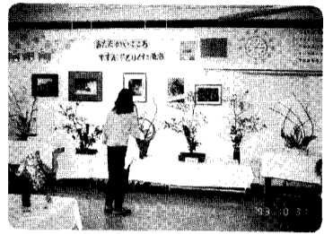
矢代田分館文化祭

又、矢代田分館文化祭(十月三十一日)、新保分館文化祭(十一月二日)にも大勢のみなさんがご来場くださいました。重ねて御礼申し上げます。