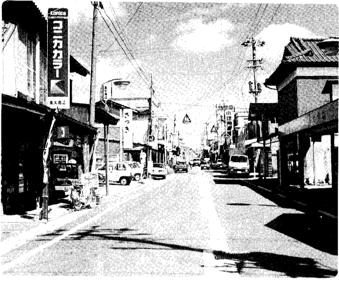
私が育った町「小須戸町」の町並み

中央公民館では、小須戸町のよりよい発展を願って昔小須戸町に住んでいて、今は他市町村に移り住まれた方や、新しく小須戸町に嫁いで来た方を対象に「我が町・小須戸町」をどのように感じ、どのように考えておられるか、その声を聞かせていただきました。