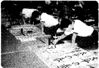
13日 矢代田小書初大会 みんな、じょうずに置けました。