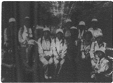
歩いた後の満足な顔、顔……。

汗かいて大満足 平成十三年度より三年間にわたって小須戸町の近隣にある里山に「健康づくり」として山登りをしてきました。今年の参加者は十五名でしたが、皆さんとても体力があり、それぞれ楽しみながら歩いてきました。