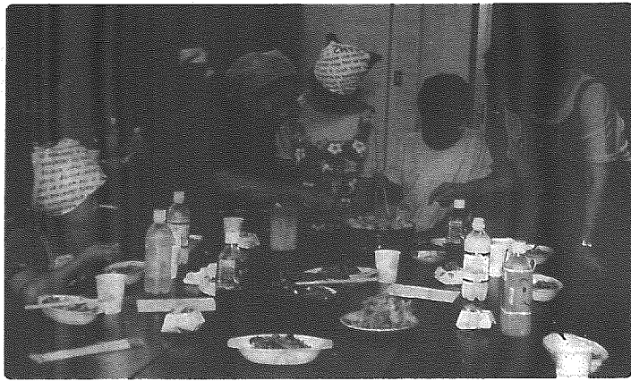
「おやまあ、うっまえげらこと〜!」「やったあ〜」

発行 小須戸町中央公民館 〒956-0101 新潟県中蒲原郡小須戸町 大字小須戸117番地 TEL (0250) 38-2234 FAX (0250) 38-3041 編集 公民館報編集委員会