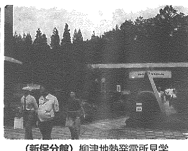
(新保分館) 柳津地熱発電所見学