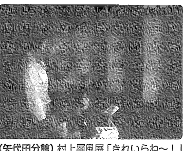
(矢代田分館) 村上屏風展「きれいらね〜!」