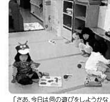
「さあ、今日は何の遊びをしようかな」 ※新潟市の配置基準=保育士1人対0・1歳児3人

小須戸保育園は平成十七年に一歳、平成十八年に〇歳児の受け入れを始めました。四月に〇歳・一歳児七名に対して保育士二人のつぼみ組がスタートしました。 お家の人との離れ際、泣き声の大きかった。一番心掛けたのは「三対一ではなく、なるべく一対一の対応をして心を満たしてあげよう」という事でした。 抱っこにおんぶをたくさんしました。一人一人の気持ちにできるだけ添ってあげました。自分の気持ちをしつかり受け止めてもらった子ども達は他の保育士にも心を開き、甘える様になりました。 心が繋がる今度は玩具や