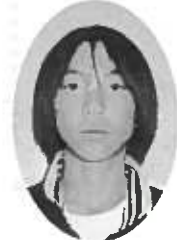
「精一杯走りたいと思います」

今回の講演会で、阿達先生が話された新潟五区エリアにおける「合併を活かした将来展望」のアイデアを次号からコラム形式で三回にわたって紹介していきたいと思えます。