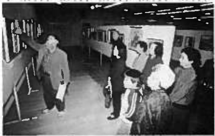
運動会、展示会も大成功!!