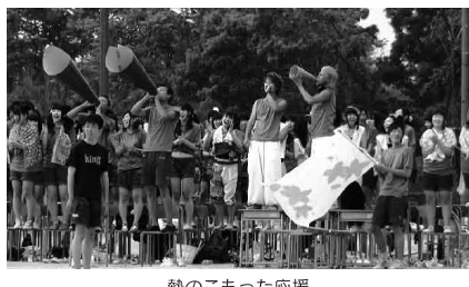
熱のこもった応援

「輝け高校生!」 新津南高等学校 今年もまた、少しの不安とたくさんの希望を抱いた新入生を迎えることができました。 私たち、高校での三年間を通じて、他者との関わりのおかげで自分を見つめ、将来は地域社会に貢献できる大人になってほしいと願っています。 写真は先月におこなわれた体育祭での風景。若さみなぎる高校生活がかけがえのない青春の一ページであることを語ってくれたように感じました。