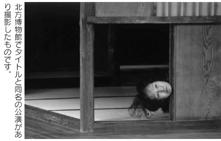
北方博物館のタイトルと同名の公演あり撮影したものです。