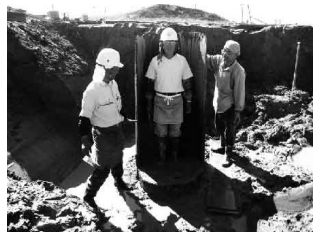
井戸枠の深さは大人1人分

「新津南高校に赴任して」 昨年十月一日に、新潟県教育庁保健体育課より、保健体育科の教諭として新津南高校に赴任して参りました。 私は秋葉区(旧新津市)の出身です。この度の転勤によって、ようやく故郷に帰って来ることができ、大変嬉しい気持ちで一杯です。 地元のために努力する所存です。 平成二十二年の小須戸商店街の大火災では、多くの方が被災されたことをニュースで知り、大変心配しておりました。赴任後、その後の様子を伺