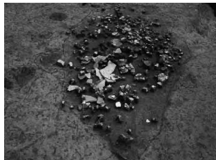
平安時代の土器がまとめて出土