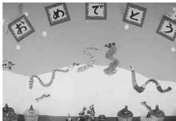
へび年が始まりました。

に蛇の話がありました。「蛇って冬の間どこにいますか？」この問いかけに対し、子どもたちからは、「外国!」「東京!」「洞穴!」「僕のお家!」と様々な答えが返ってきて、職員一同大笑いでした。