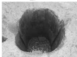
割り貫き材を合わせた井戸枠