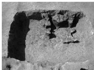
出土したアスファルト