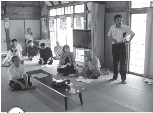
小須戸の歴史散歩 (7月開催)