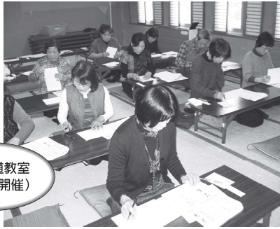
ブチ書道教室 (12月開催)