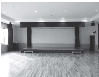
写真 右上 2階 和室 右中 2階 調理室 右下 2階 研修室 左上 3階 多目的ホール

で、入場券が必要です。入場を希望される人は、小須戸出張所とふれあい会館(矢代田)に整理券がありますので、申し出てください。 入場券は先着順で100枚の予定で、三月二十日(金)から申し込みが可能です。また、当日は、小須戸喧嘩太鼓や「結心こすど」の皆さんによるよさこい演舞も披露される予定です。