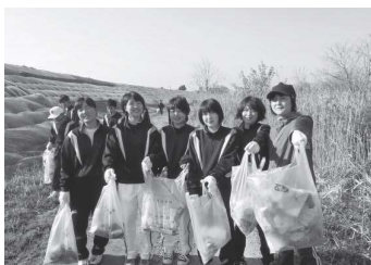
親水公園クリーン作戦

これらの取組を通して、生徒は学校の教育活動とは異なる場で、多様な人とのかわりを経験し、貴重な体験を積りながら、様々な年齢・立場の人たちと一緒に活動することを大切にしていきたいと思っています。