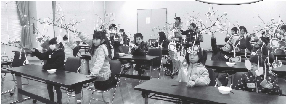
まゆ玉づくり体験 (1月開催)