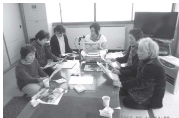
真心こめての録音風景