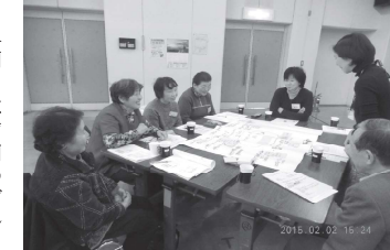
居場所のイメージについて話し合う

「コミュニケーション・コーディネーター」とは地域活動の担い手であり様々な団体等で活動し、地域のつなぎ役となる人です。