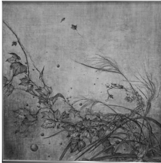
「秋草図」 — Homage to Hoitsu — (左隻)

日本画、洋画、版画、彫刻、工芸、書道、写真の7部門に4069点の応募があり、1108点が入賞、入選。 これらの作品が先月、朱鷺メッセに展示されました。小須戸地区から5人の方の作品が入選されました。おめでとうございます。