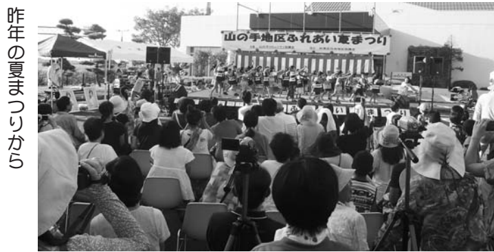
昨年の夏まつりから