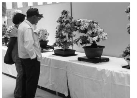
見事な花々に時を忘れ鑑賞する来場者

た地域環境と生活習慣での勉強・修行・習得をいろいろと体験し、得るものがたくさんありました。 限られた文章で言えることは仕事の取組姿勢として、「責任感、規律性を持った仕事をする」、「組織の一員としての協調性を持つこと」などいろいろありますが組織を小須戸住人に置き換えて考えるのも一つかなと最近思っています。