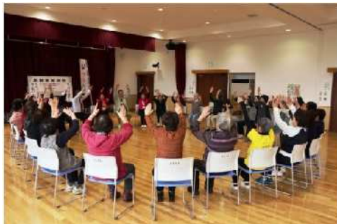
昨年度に開催した「笑いヨガ体験」の様子