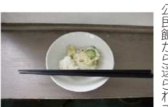
出来上がったごはんとおはよう朝ごはん

今年度6回目となった「おはよう朝ごはん料理講習会」が、小須戸中学校1年生を対象に2月17日(月)に行われました。実習のテーマは「サバイバル食」として、ポリ袋を使って①ごはん②野菜スープ③お菓子のじゃがりこを使ったポテトサラダづくりに行いました。まず初めにお米を洗い、1人当たり75gのお米をポリ袋に入れ、水を入れて空気を抜く工程を行いました。次に野菜スープは、キャベツを手でちぎって細かくし、ポリ袋にもやしなどのその他の食材と水と味付けのため昆布茶を入れて、空気を抜いて口を結んで、沸騰したお湯に入れ、じゃがりこを沸騰したお湯を容器の半分ぐらい入れて