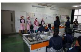
生徒代表からサバイバル食の意義と食事のバランスについて学んだと挨拶がありました

ふやかします。その後スプーンでほぐして、切ったきゅうりとハムとマヨネーズを入れて混ぜます。調理を始めて、1時間程度で3品作ることができました。ごはんは野菜スープについては、災害時を想定して、ポリ袋を茶碗に入れて、結んだ口を切って洗ったお湯を注ぎ、体験もしました。指導員は、朝食の重要性について、中央公民館から送られてきた