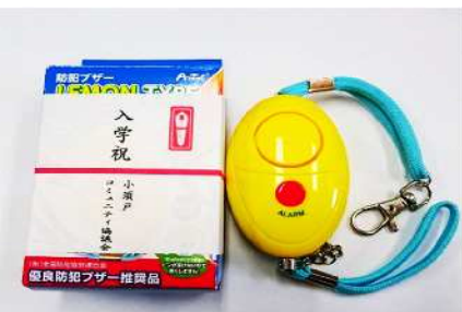
新入学児童に贈呈される防犯ブザー

また、コミ協の防犯部会は「こすどっ子見守り隊」というボランティアさんたちと一緒に、普段の生活の中で児童の登下校の見守りを行う活動を行っています。4月は新入学児童の下校ボランティアとして、一年生と一緒に下校します。見守る目が多いほど、犯罪は起きにくくなります。地域の皆さまも犬の散歩や農作業などをしながら子供たちの安全を見守っていただきたいと思います。