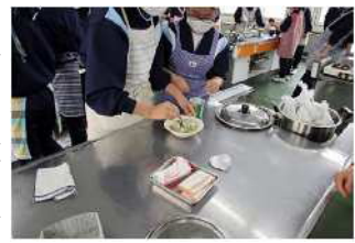
ふやかしたじゃがりこにきゅうりとハムとマヨネーズを混ぜる工程

今年度6回目となった「おはよう朝ごはん料理講習会」が、小須戸中学校1年生を対象に2月17日(月)に行われました。実習のテーマは「サバイバル食」として、ポリ袋を使って①ごはん②野菜スープ③お菓子のじゃがりこを使ったポテトサラダづくりに行いました。まず初めにお米を洗い、1人当たり75gのお米をポリ袋に入れ、水を入れて空気を抜く工程を行いました。次に野菜スープは、キャベツを手でちぎって細かくし、ポリ袋にもやしなどのその他の食材と水と味付けのため昆布茶を入れて、空気を抜いて口を結んで、沸騰したお湯に入れ、じゃがりこを沸騰したお湯を容器の半分ぐらい入れて