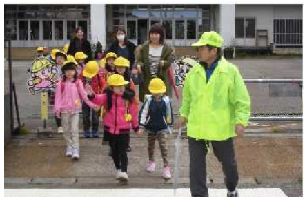
「こすどっ子見守り隊」による1年生下校ボランティア