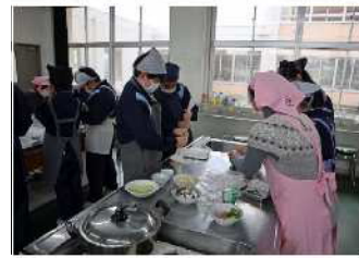
ポリ袋に入っているお米(75g)に水を入れて空気を抜く工程