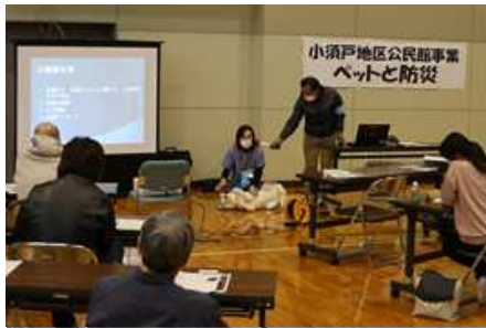
↑昨年の講座の様子

申込方法 6月15日(水)～7月1日(金)までに小須戸地区公民館 TEL0250-25-5715に電話で申し込んでください。