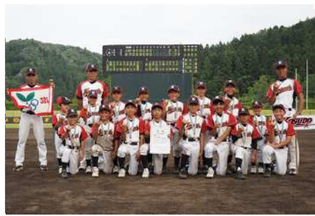
次もぜひ、がんばってください！ 於:6月19日(日)三条市パール金属野球場

6月18日・19日に開催された第44回新潟県スポーツ少年団軟式野球交流大会で小須戸野球スポーツ少年団が準優勝し、7月2日(土)から開催された第44回全国スポーツ少年団軟式野球交流大会北信越大会に6年ぶりに出場しました。初戦、長野県代表に9対5で完勝しましたが準決勝で富山代表に3対7で惜敗しました。子どもたちの活躍に大きな拍手を送ります。