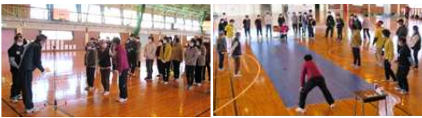
表彰式で賞状をもらうスクールAのみなさん

3月5日(日)、小須戸コミ協と共催で、小須戸体育館において、12チーム36名で初めて大会を行いました。大会結果は左表のとおりです。