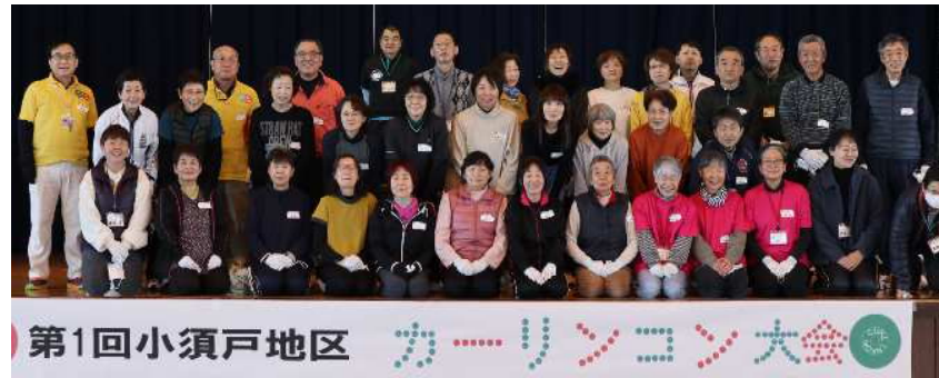
第1回小須戸地区カーリンコン大会