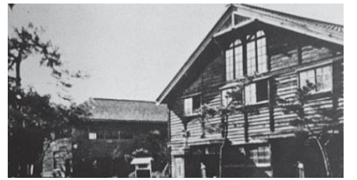
小須戸小学校は、大川前4の児童公園の場所にあった。