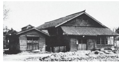
横水小学校は、小向の横水保育園(現在のほほえみ作業所)の場所にあった。