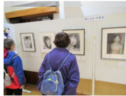
昨年の市民展の様子