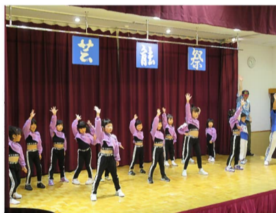
昨年の芸能祭の様子