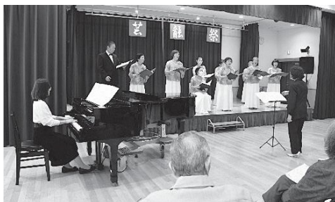
コール・あじさい