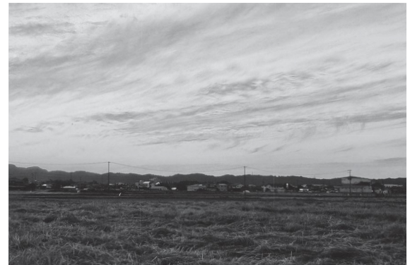
特に気に留めないような日常にも意識的に捉えることで魅力を感じるものが多いと思い、普段から通る道で撮影を行いました。