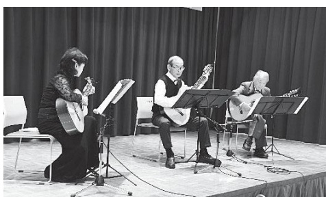
小須戸クラシックギタークラブ