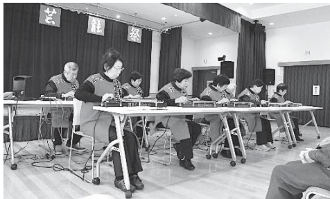
小須戸大正琴愛好会

11月10日(日)、小須戸まちづくりセンターで開催され、13団体の出演があり、大正琴、ピアノ、トロンボーン、クラシックギター、ストリートダンス等様々なジャンルを楽しむことが出来ました。3階ホールを埋め尽くすほどの270名の観客が来場しました。