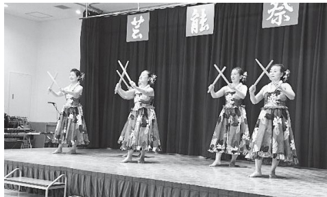
ファイフラ オレイ アロハ