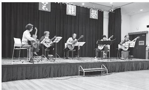
ギタークラブ テクテク