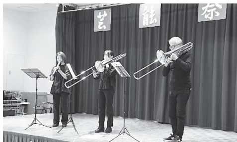
NWE トロンボーンアンサンブル