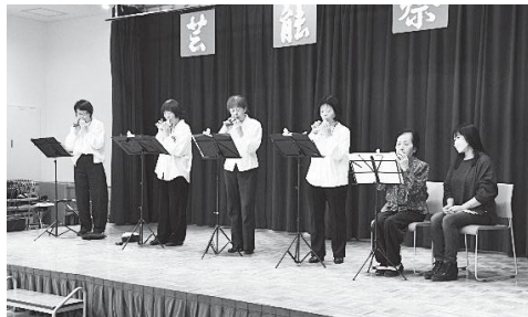
ライリッシュオカリナクラブ