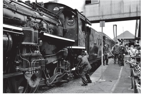
津川駅で待ち構えて撮った写真の中の1枚です。中央に写っている機関士さんは釜の掃除をしているらしいのですがハッキリとは分かりません。

力強さの中に流れが感じられる行書のような雰囲気にも魅力を感じ挑戦しました。流れと筆圧に意識して書くのが難しかったです。