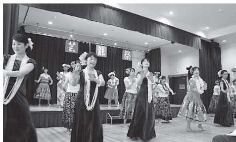
小須戸フリスビーオーケッド、ブルメリア&フリスビーピカケ