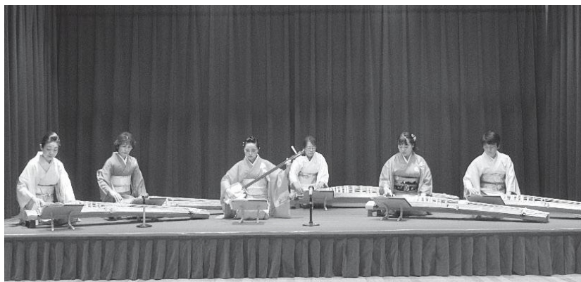
秋の演奏会の様子

雅楽斐会では、体験ができます。楽器に触れて、おしゃべりするだけでも大歓迎です。興味のある方は活動日に直接会場へお越しください。お待ちしております。