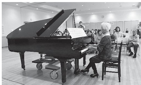
もしもピアノの会