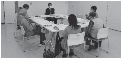
活動協力員会議の様子

公民館の力強い助っ人 「公民館活動協力員」を募集します。 あなたもやってみませんか？