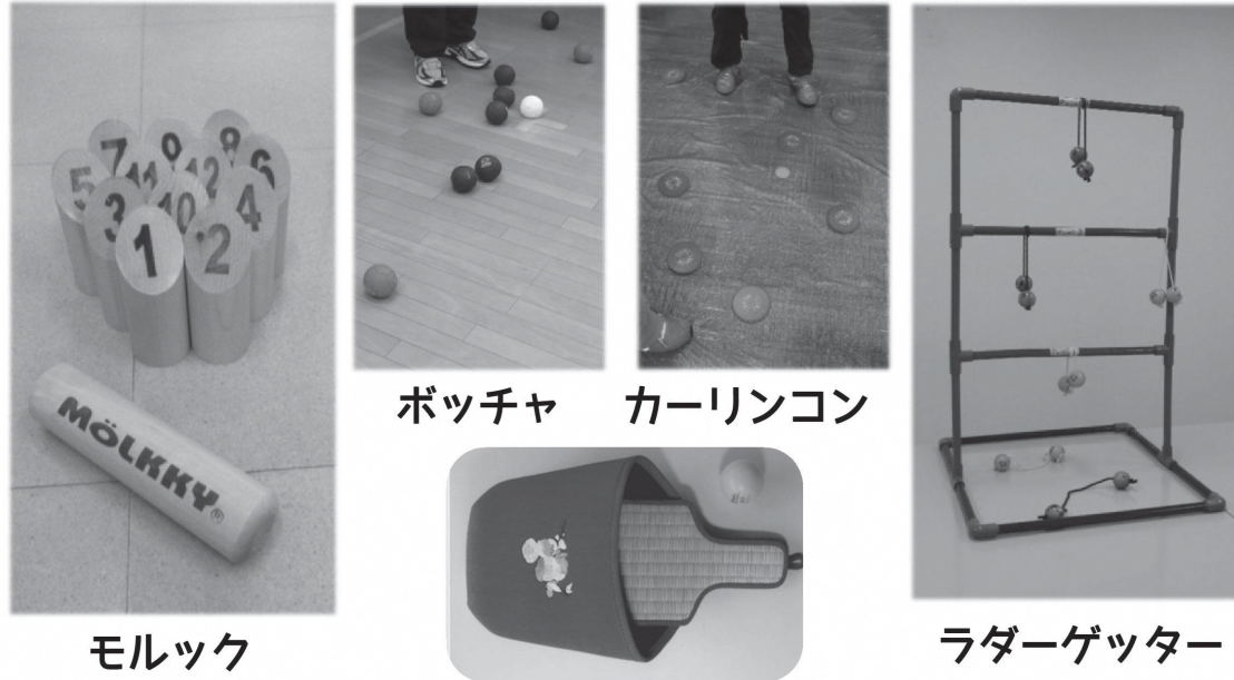
モルック ボッチャ カーリンコン ラダーゲッター スリッパ卓球