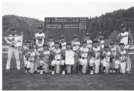
次もぜひ、がんばってください！ 於：6月19日(日)三条市パール金属野球場

時間：午前10時～11時30分 会場：新津南高等学校 (新潟市秋葉区矢代田 3200-1) 持ち物：筆記用具、マスクほか 参加費：申込時にお問い合わせください。定員：各回先着15名 申込み締切：9月9日(金) 各回の申込みが可能です。申込み・問合せ：小須戸地区公民館 ☎0250-25-5715 平日9:00から17:00まで