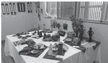
令和元年の市民展・芸能祭の様子