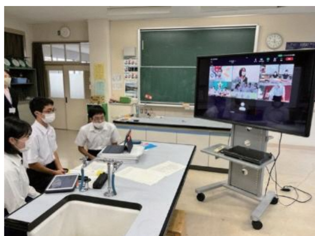
中学生による子どもの権利に関する意見交換会