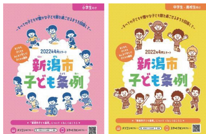
子ども条例周知・啓発用パンフレット