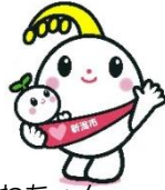
ほのわちゃん 新潟市子育て応援キャラクター