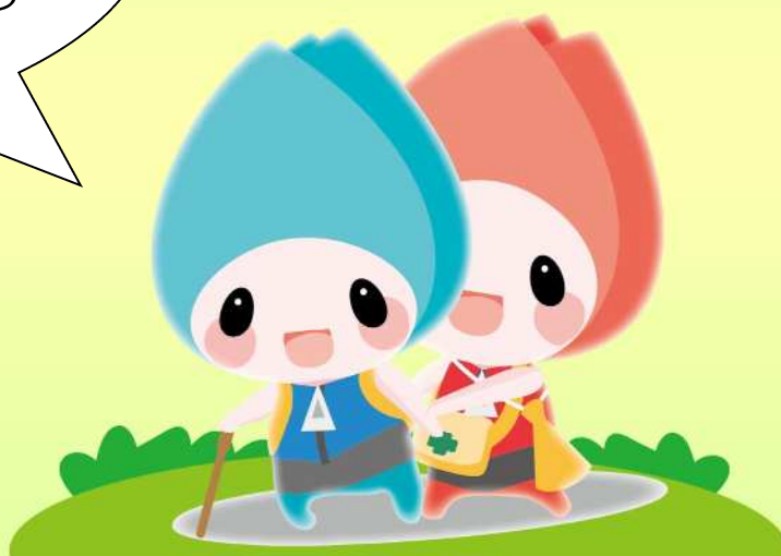
新潟市防災マスコットキャラクター ジージョ キョージョ