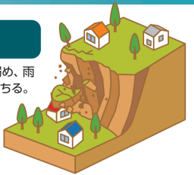
平成10年8月4日の大雨による「がけ崩れ」の様子