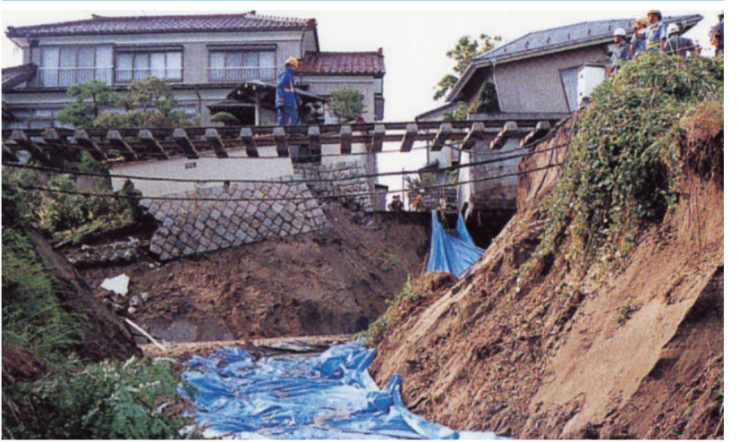
市内の市街地で集中豪雨によりがけ崩れが発生したものです。