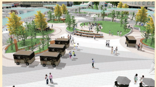
新潟駅デッキテラス(2階)から東大通方向を望む。(イメージ)

●万代広場から階段・エスカレーター・エレベーターでペDESTリアンデッキに上がり、駅構内や広場を東西方向に移動することが可能になります。