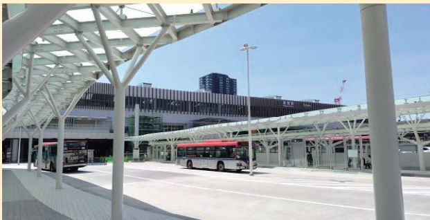
新潟駅バスターミナル(高架下交通広場)

●鉄道とバスの乗り換えが便利になるとともに駅南北を直接結ぶバス路線の運行が可能になりました。