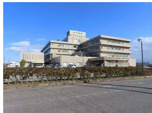
写真 6-33 豊栄病院