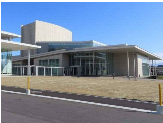
写真 6-32 北区文化会館