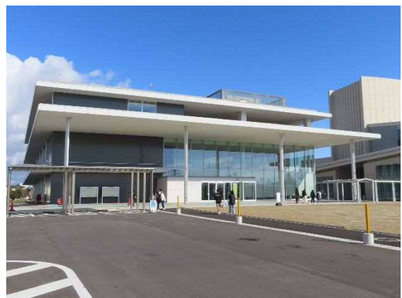
写真 6-31 北区役所