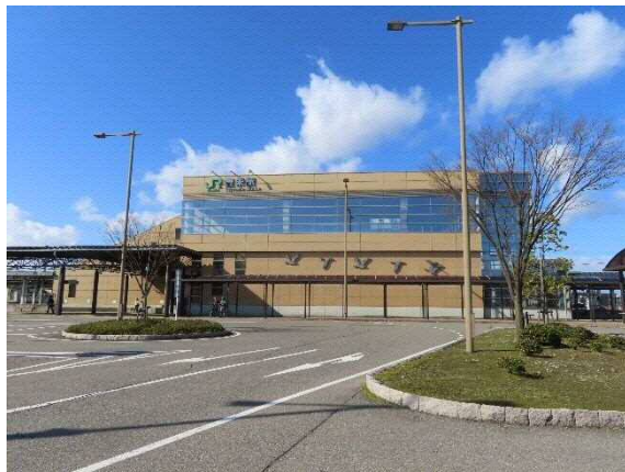
写真 6-30 JR 豊栄駅