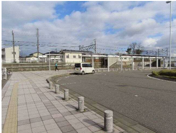
写真 6-34 JR 越後石山駅