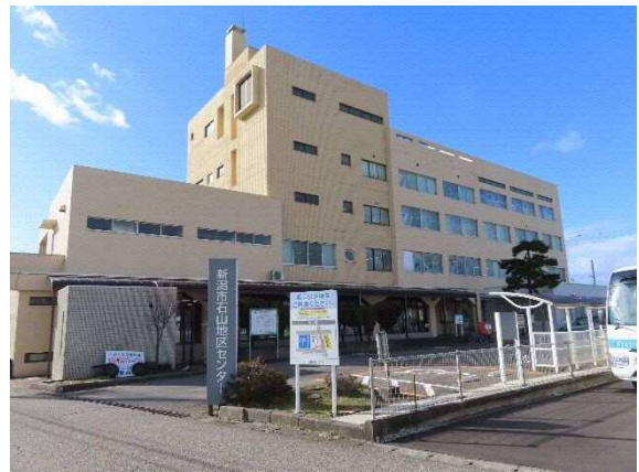
写真 6-35 石山地区センター