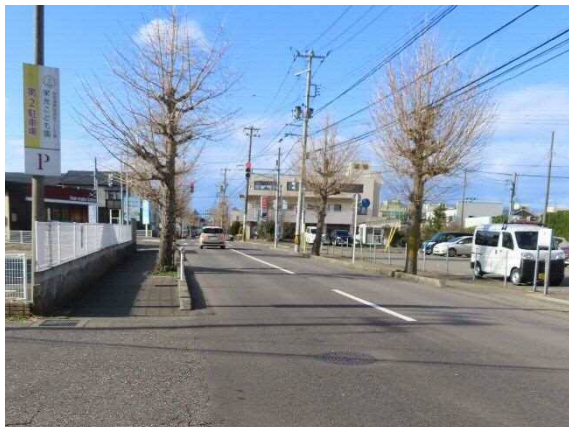
写真 6-36 石山地区センター前の道路