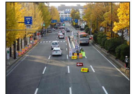
〈写真⑤〉 「駅前通」路上バス停 (新潟駅 方面) の状況