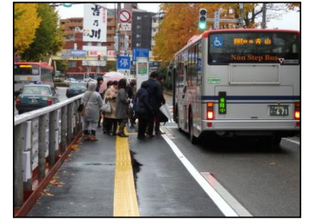
〈写真④〉 路上バス停の利用状況