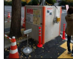
〈写真②〉 押ボタン式信号機と 音声ガイド