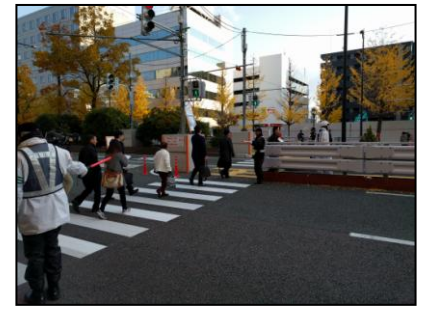
〈写真③〉 社会実験に伴ない設置した信号・ 横断歩道の利用状況