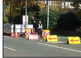
〈写真①〉 車両誘導の状況