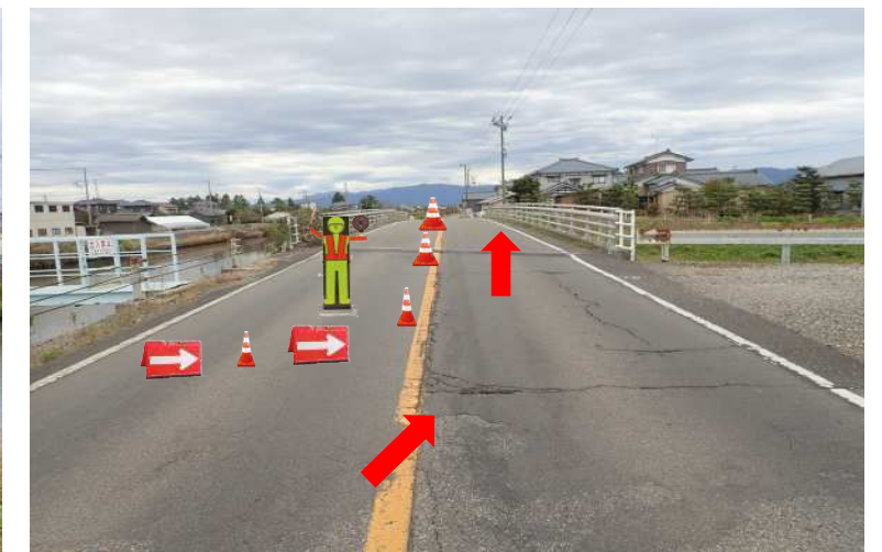
交通規制のイメージ(車道の片側交互通行規制)