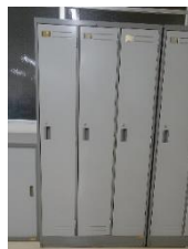
不要備品の再利用

職員の昼食時に使用する箸はリユース箸の使用を推奨し、割り箸等の使い捨て箸製品を削減しています。お茶を飲む時は湯呑茶碗を使用し、リユースしています。蛍光ペン等はインキが無くなったら補充して都度廃棄せずに継続して使用しています。