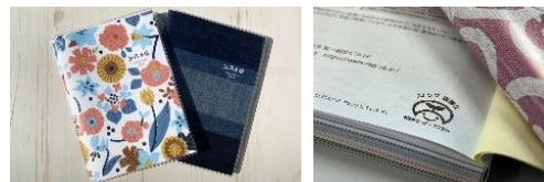
自社製品にカーボンオフセットのマークを表示