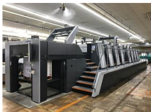
LED-UV印刷で、使用エネルギーを抑えた高生産な印刷を実現