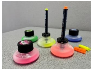
文具等の使い捨て削減