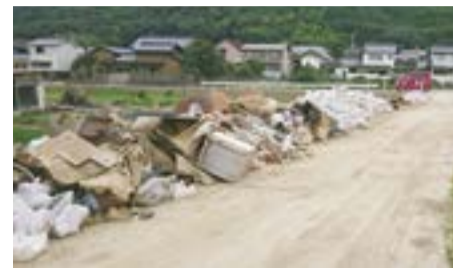
道路に投棄された様子(平成30年西日本豪雨)

なお、生ごみなどの腐りやすいごみは分別をお願いします。他の災害廃棄物と一緒にすると、衛生環境の悪化につながるほか、災害廃棄物全体の処理が困難になってしまいます。