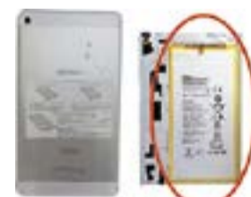
リチウムイオン電池

スマートフォンのような小型家電の電池類は、取り外しが難しい作りになっています。「燃やさないごみ」などに出してしまうと、処理過程の衝撃でショートし、火災の原因となり大変危険です。電池類が取り外せない場合は、必ず本体ごと「特定5品目」に出しましょう。